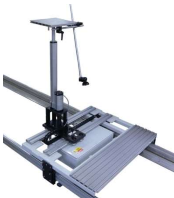
Kalibrační lavice CB-50