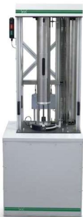
Neutronový ozařovač NI-01