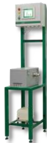
Monitory aktivity aerosolů CPM-300